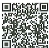
山口県作業療法士会 LINE 公式アカウント