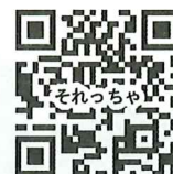
それっっちゃデジタル版