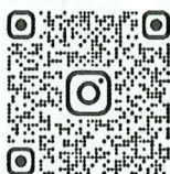
山口県作業療法士会 公式 Instagram