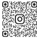
山口県作業療法士会 公式 Instagram