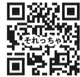
それっっちゃデジタル版