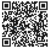
山口県作業療法士会 LINE 公式アカウント